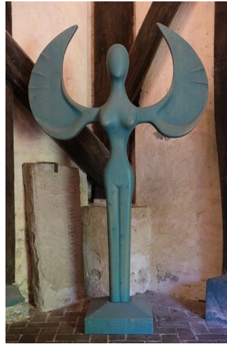
Engel des Lilienthaler Künstlers Hans – Georg Filipschack (1933 – 2020). Eine weitere Skulptur finden Sie im Park hinter der Kirche.